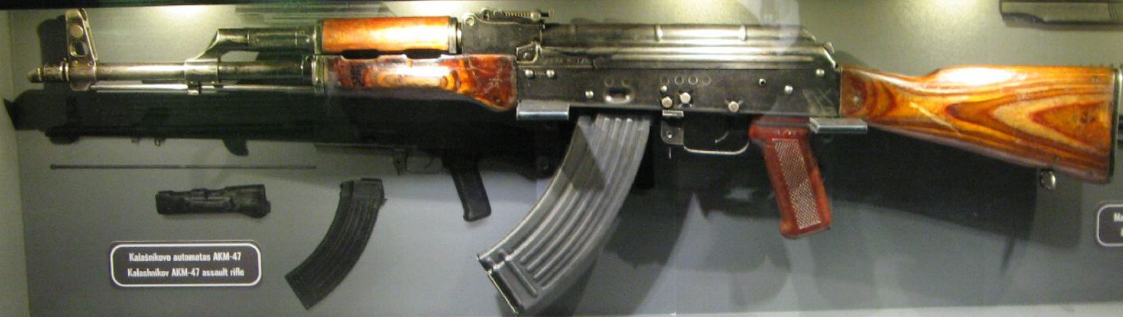
Kalašnikov automaattiasu AKM-47 Kalashnikov AKM-47 assault rifle