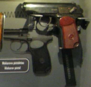
Makarov pistolet Makarov pistol